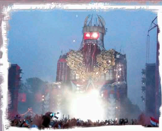
Het publiek danst voor HUN god

Als we dwars over het terrein zijn gelopen komen we aan bij het hoofdpodium. Er staat een heel veld vol met meer dan tienduizend mensen. Hier wordt duidelijk wie vanavond zijn feestje viert. Het podium is een enorme stelling met een sinistere man op een troon, met grote klauwen die de leuning van zijn troon omvatten. Is dit Dagon, de god van de Filistijnen? Is dit het broertje van Baäl, in een Nederlands weiland? Satan viert hier feest, niet stiekem of verscholen, maar openlijk. Deze plaats voelt fout, hier heersen de demonen en hier krijgt de oproep van Petrus 'Laat u redden uit dit verdorven geslacht' een nieuwe betekenis. Bij verkooppunten gaan t-shirts met hardcore-doodskoppen over de toonbank. Het publiek danst voor hun god.