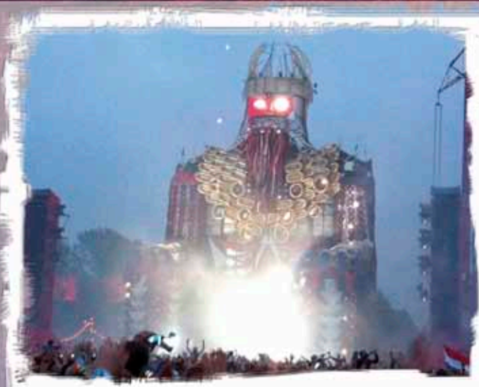
Het publiek danst voor HUN god

Als we dwars over het terrein zijn gelopen komen we aan bij het hoofdpodium. Er staat een heel veld vol met meer dan tienduizend mensen. Hier wordt duidelijk wie vanavond zijn feestje viert. Het podium is een enorme stelling met een sinistere man op een troon, met grote klauwen die de leuning van zijn troon omvatten. Is dit Dagon, de god van de Filistijnen? Is dit het broertje van Baäl, in een Nederlands weiland? Satan viert hier feest, niet stiekem of verscholen, maar openlijk. Deze plaats voelt fout, hier heersen de demonen en hier krijgt de oproep van Petrus 'Laat u redden uit dit verdorven geslacht' een nieuwe betekenis. Bij verkooppunten gaan t-shirts met hardcore-doodskoppen over de toonbank. Het publiek danst voor hun god.